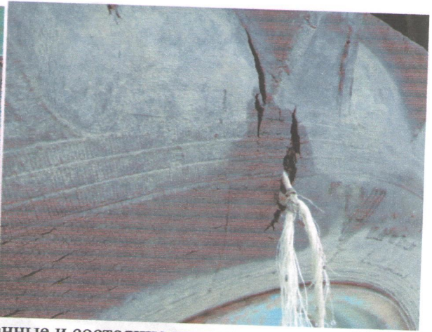
Идентификационные данные и состояние шин.